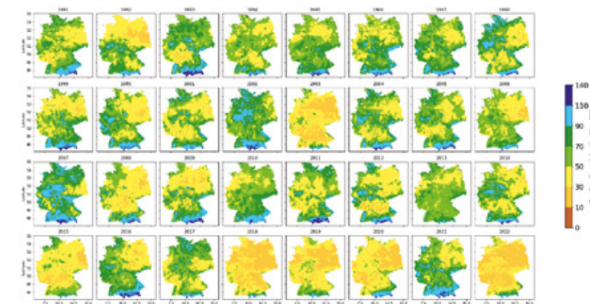
Abbildung 2: Karten der mittleren Bodenfeuchte unter Gras in der Bodentiefe 0 bis 60 cm in den Sommermonaten für die Jahre 1991 bis 2022, in Prozent nutzbare Feldkapazität (nFK)