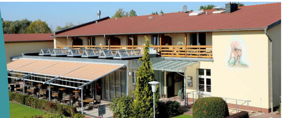
Das neue Gebäude in der Gemeinde Klietz vereint zwei Nutzungen unter einem Dach: Praxisräume und Hotelzimmer.

Klietz ist ein idyllisch gelegenes Dorf mit gut 1 800 Einwohnern in der LEADER-Region „Elb-Havel-Winkel“. Weil die medizinische Versorgung verbessert und gesichert werden musste, suchte die Region nach Lösungen.