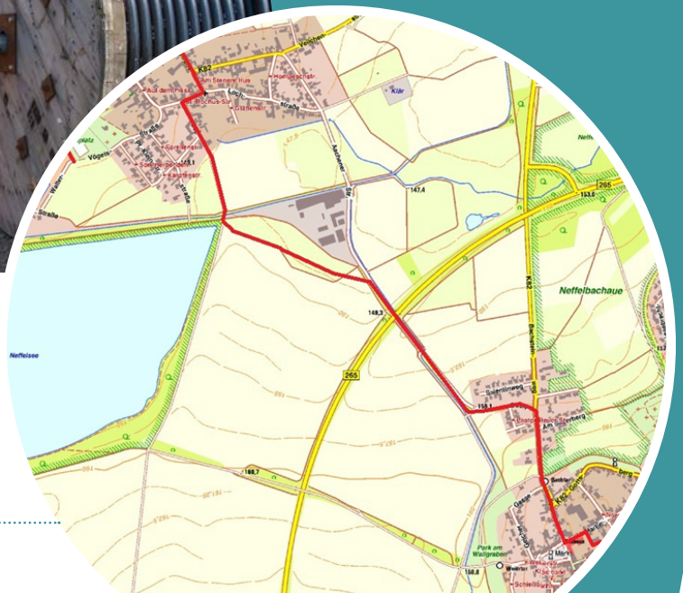
Verlauf der Kabeltrasse im Ortsteil Füssenich (rot)