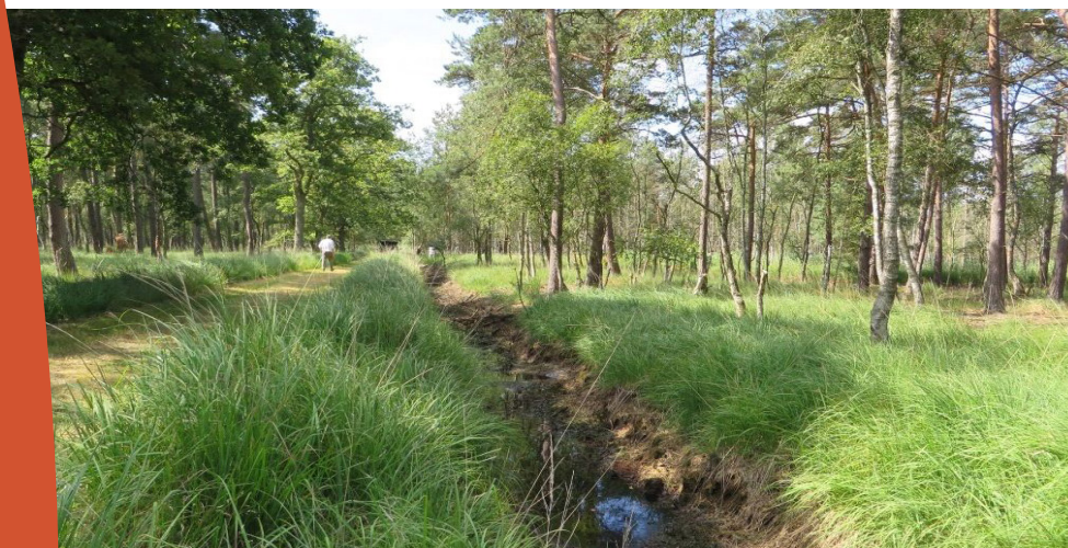
Das Regenmoor Osterwald Zingst vor Umsetzung der Maßnahmen: leere oder fast leere Gräben in den Sommermonaten.