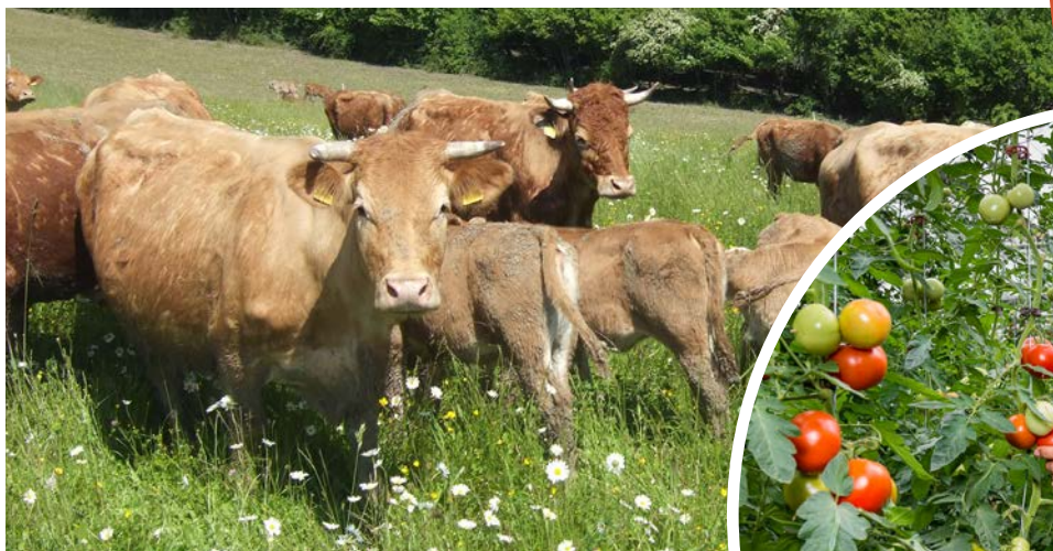
Auf dem Wintringer Hof wird Gemüse ökologisch angebaut. Der Betrieb gehört der „Lebenshilfe für Menschen mit Behinderung Obere Saar e.V.“ und arbeitet inklusiv.