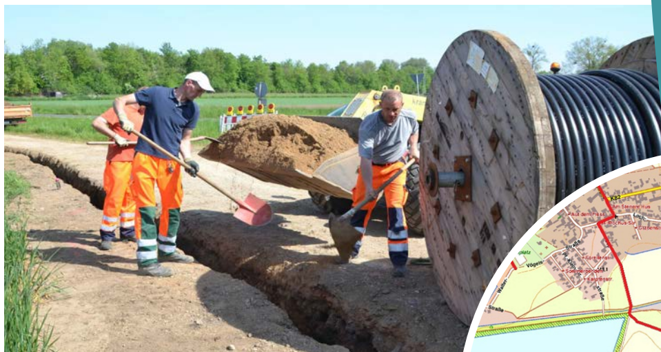
In den Zülpicher Ortsteilen wurden rund 30 Kilometer Glasfaserkabel verlegt.

In den Ortsteilen wurden schließlich rund 30 Kilometer Glasfaserkabel verlegt und 24 Multifunktionsgehäuse neu aufgestellt oder mit moderner Technik ausgestattet. Innerhalb von rund 13 Monaten erhielten so 1 385 Haushalte und 310 Betriebe die Voraussetzungen für Breitbandanschlüsse mit bis zu 50 Mbit pro Sekunde. Für's Kaffeekochen bleibt beim schnellen Internetsurfen nun keine Zeit mehr.