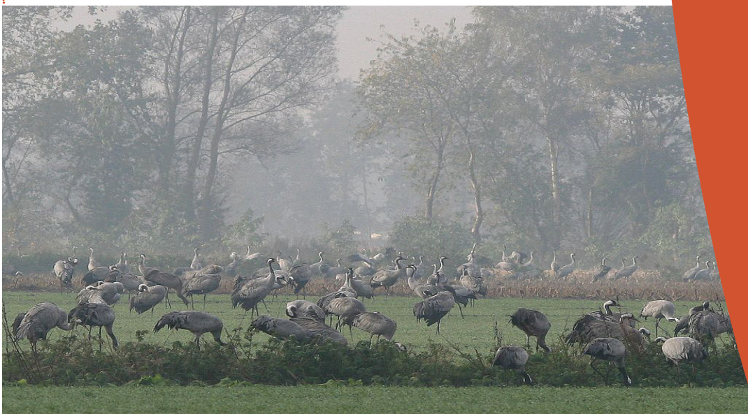
Kranichrast in der Diepholzer Moorniederung