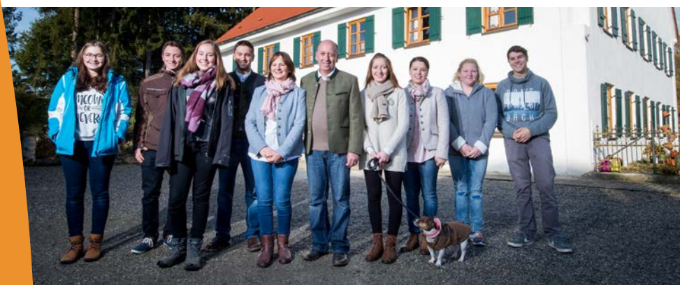
Familie Gelb mit ihren Lehrlingen

Amt für Ernährung, Landwirtschaft und Forsten Augsburg Bismarckstr. 62 86391 Stadtbergen Telefon: 0821 43002-0 poststelle@aelf-au.bayern.de www.aelf-au.bayern.de