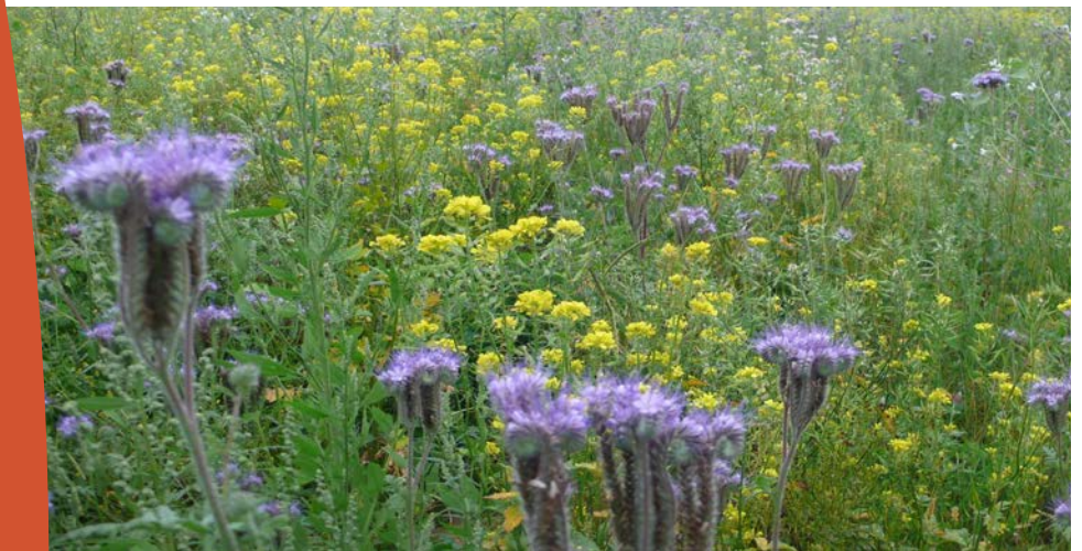
Blüh- und Schonstreifen sind Nahrungsquelle und Unterschlupf für Insekten auf Ackerflächen.

* Mittel für die Maßnahme in ganz Nordrhein-Westfalen