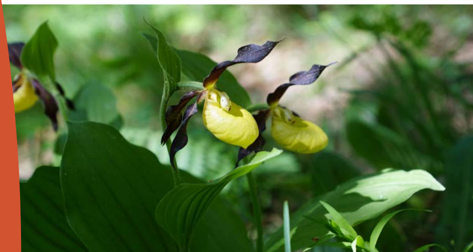
Der Frauenschuh gehört zu den seltenen Orchideenarten. Im Wald der FBG Jüchsen gibt es ihn noch.

Forstbetriebsgemeinschaft (FBG) Jüchsen Schafgasse 6a 98631 Grabfeld OT Jüchsen Telefon: 036947 523073 fbg.juechsen@t-online.de