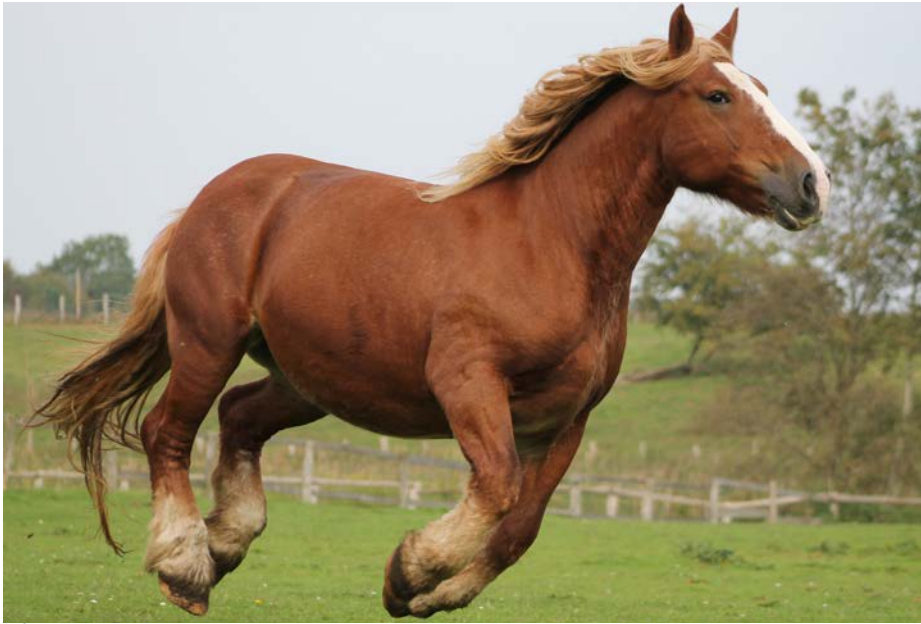
Das Schleswiger Kaltblut ist eine der Haustierrassen, deren Zucht die OG „Tiergenetische Ressourcen“ fördern möchte.

Der Bestand vieler alter, regionaltypischer Haustierrassen ist so stark geschrumpft, dass das Inzuchtmanagement Züchter vor große Herausforderungen stellt. Nun werden in einem Projekt zukunftsfähige Lösungen für die Züchtung kleiner Populationen entwickelt.