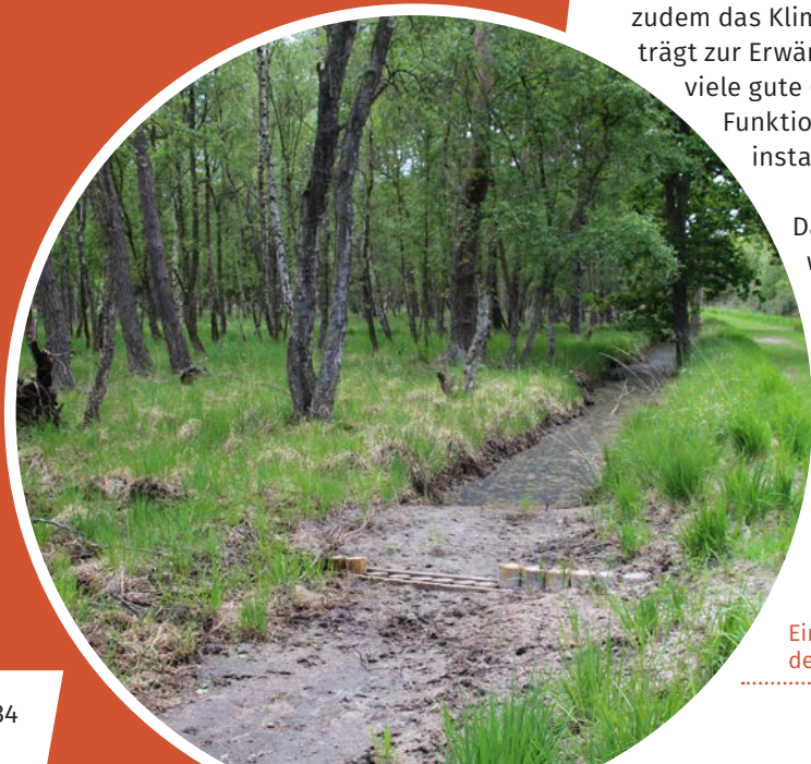
Ein Grabenverbau unterstützt die Wiedervernässung der umliegenden Flächen.

Ein Projekt hat diesen Prozess nun gestoppt: Dafür wurden im Grabennetz des Osterwaldes Verbaue angelegt, die dazu beitragen, dass die Moorflächen vernässen. Gleichzeitig war es wichtig, mithilfe von Gräben, Straßendurchlässen sowie regulierbaren Stauwerken in den Moorrandbereichen dafür zu sorgen, dass die angrenzenden Siedlungen und Straßen bei hohen Niederschlägen vor Überflutung sicher sind. Auch Wander-, Reit- und Fahrradwege wurden gesichert: Sie sind höhergelegt worden. Das Moor darf nun wieder nass werden.