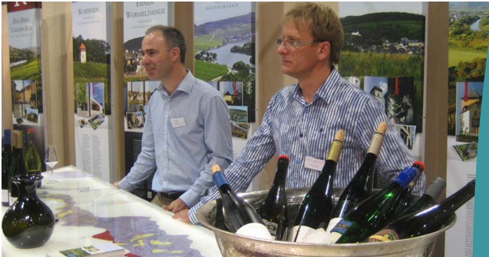
Die deutschen, luxemburgischen und französischen Weinbaugebiete an der Mosel haben eine länderübergreifende Vermarktungsstrategie für Wein und Tourismus.

Wer an die Mosel denkt, denkt unweigerlich auch an Wein. Seine jahrhundertealte Anbau-Tradition verbindet die Menschen, die an der Mosel leben – ob nun in Deutschland, Frankreich oder Luxemburg. Deshalb haben die Weinbaugebiete aller drei Staaten in einem LEADER-Kooperationsprojekt eine Strategie entwickelt, um ihre Moselweine und die Region gemeinsam zu vermarkten.