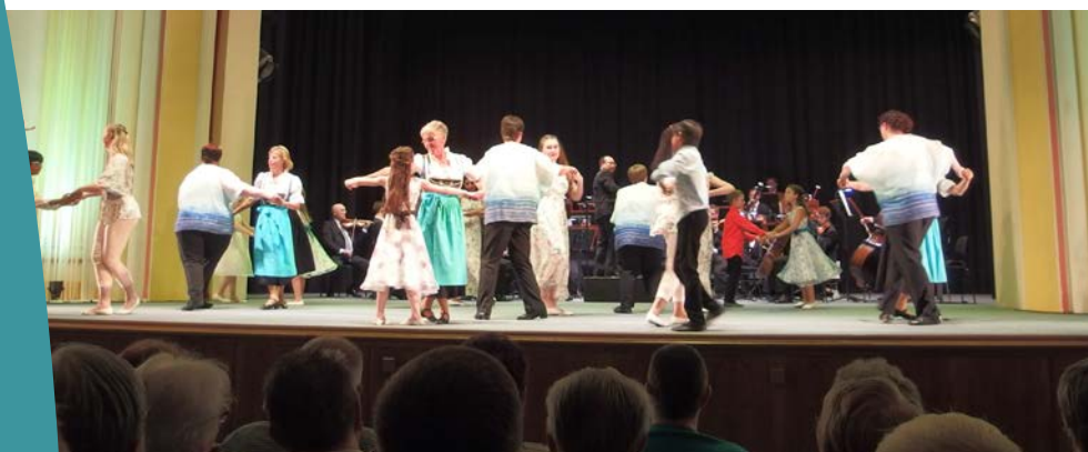
Während der Premiere im ausverkauften Kulturhaus Aue

LAG Zukunft West erzgebirge e. V. Schneeberger Str. 49 08324 Bockau Telefon: 03771 7196040 verein@zukunft-westerzgebirge.eu www.zukunft-westerzgebirge.eu www.vielharmonietanzt.de