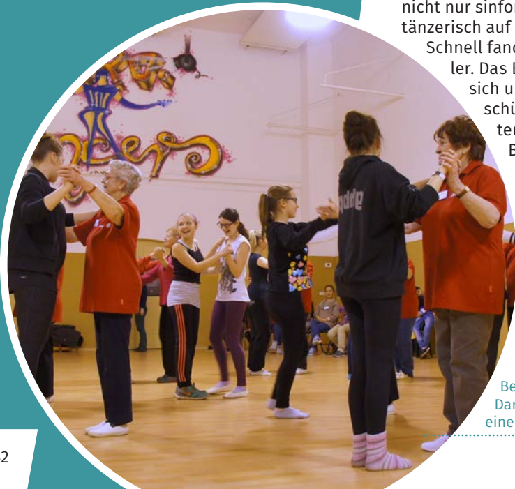
Bei den Proben haben sich die Darsteller kennengelernt und sind zu einer Gruppe zusammengewachsen.

Schließlich stand das große Ereignis bevor: Die Erzgebirgische Philharmonie Aue und 40 Laiendarsteller spielten und tanzten Beethovens „Pastorale“ im Kulturhaus Aue. Die zwei Aufführungen waren ein großer Erfolg. Die Darsteller wurden mit tosendem Applaus und Begeisterungspfiffen gefeiert. Die breite Berichterstattung in lokalen und überregionalen Medien spricht dafür, dass die harmonische Inszenierung mit so unterschiedlichen Akteuren viele Menschen für die Themen Integration und Inklusion sensibilisieren konnte.