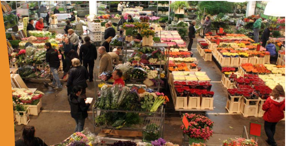
Buntes Treiben auf dem Blumengroßmarkt Frankfurt

Auf dem Blumengroßmarkt Frankfurt kann der Fach-Einzelhandel werktags Blumen und Zierpflanzen von regionalen Erzeugern erwerben. Das Großmarkt-System ist allerdings mit belastenden Arbeitszeiten verbunden. Ein Zusammenschluss aus Gartenbaubetrieben und Blumengroßhandel will nun Lösungen finden.