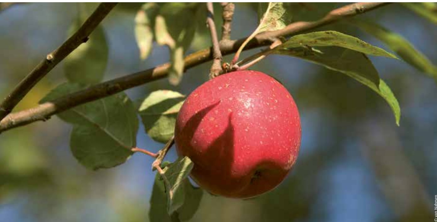
„Rote Sternrenette“ mit typischen sternförmigen Schalenpunkten

Streuobstsaft mit Geschichte vom Niederrhein