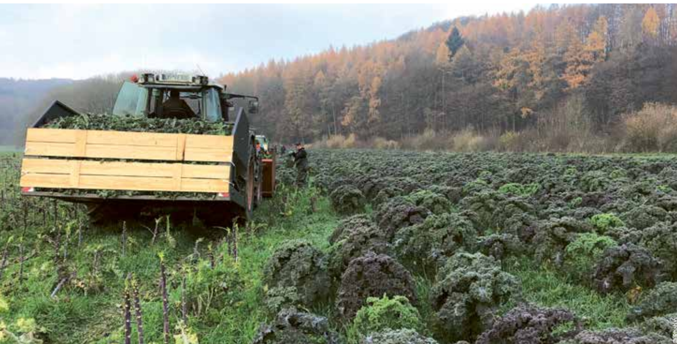
Handernte der Lippischen Palme

Wertschöpfung in der Landwirtschaft und Erhaltung eines regionalen Kulturguts