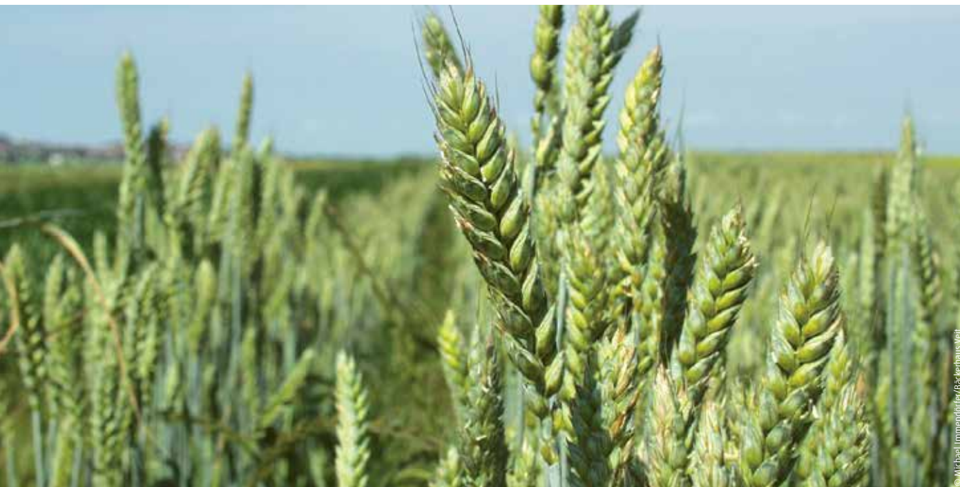
Feld mit Schwäbischem Dickkopf-Landweizen

Ein Bäckerhaus verbindet Regionalität, Biodiversität und guten Geschmack