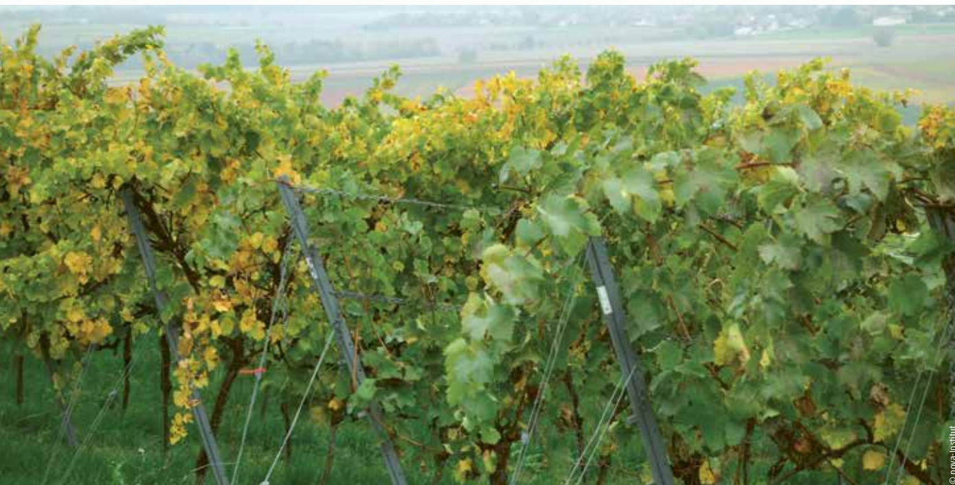
Weinberg mit Rebstöcken des Gelben Orleans.