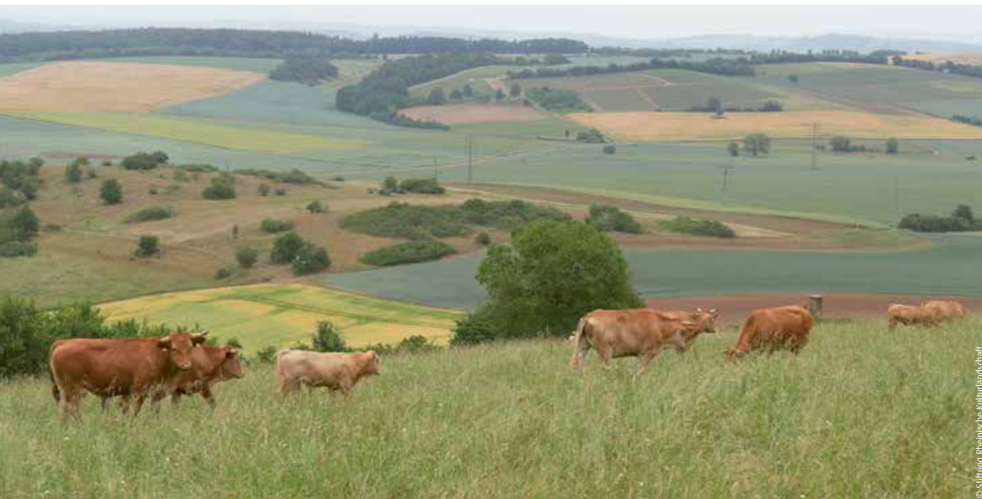
Glanrinder vom Bainerhof beweiden eine Naturschutzfläche

Vermarktung alter Rassen über EDEKA-Märkte in deren Ursprungsregionen