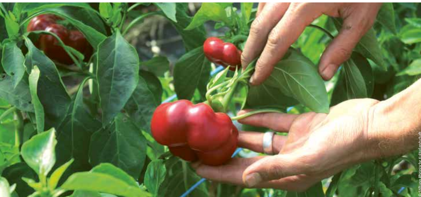
Alte Sorte „Tomatenpaprika“ auf einem Biobetrieb bei Freiburg

Neue Genussvielfalt mit alten Gemüsesorten rund um Freiburg und den Bodensee