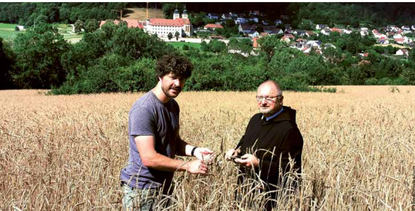
Im Getreidefeld des Klosters Plankstetten