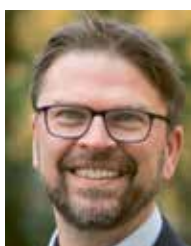
Thomas Muchow Stiftung Rheinische Kulturlandschaft