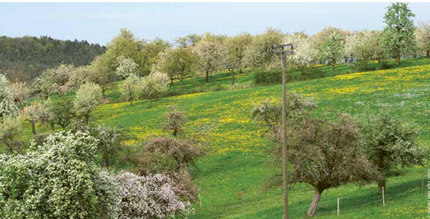
Extensiv genutzte Streuobstwiese in Franken

Eine fränkische Region profitiert von ihren Streuobstwiesen und alten Sorten