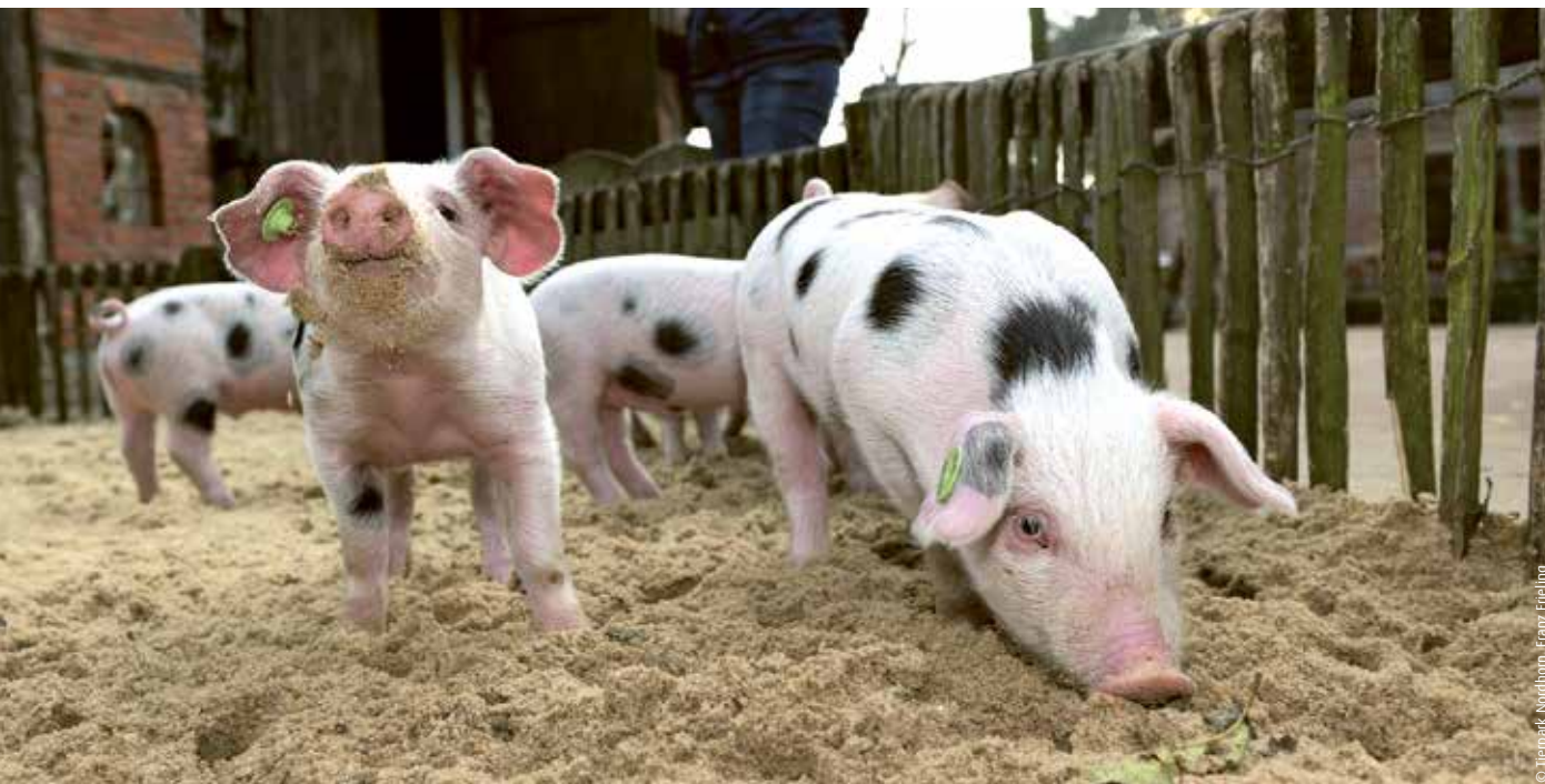
Bunte Bentheimer Schweine im Tierpark Nordhorn

Ein Highlight für Genussmenschen und Tierfreunde