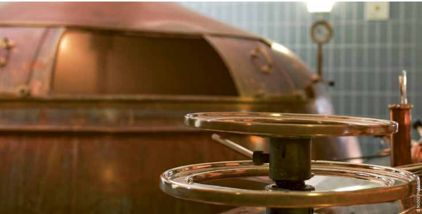
Brauanlage in der Gräflich von Mengersen'schen Dampfbrauerei

Start-up mit historischen Gerstensorten und westfälischer Geschichte