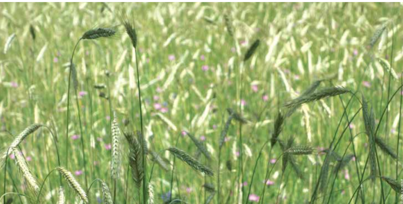
Feld mit Champagner-Roggen in der Oberlausitz

Eine Erfolgsgeschichte in der Oberlausitzer Heide- und Teichlandschaft