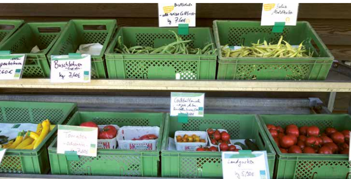
Alte Gemüsesorten im Verkauf des Hofladens der Domäne Dahlem