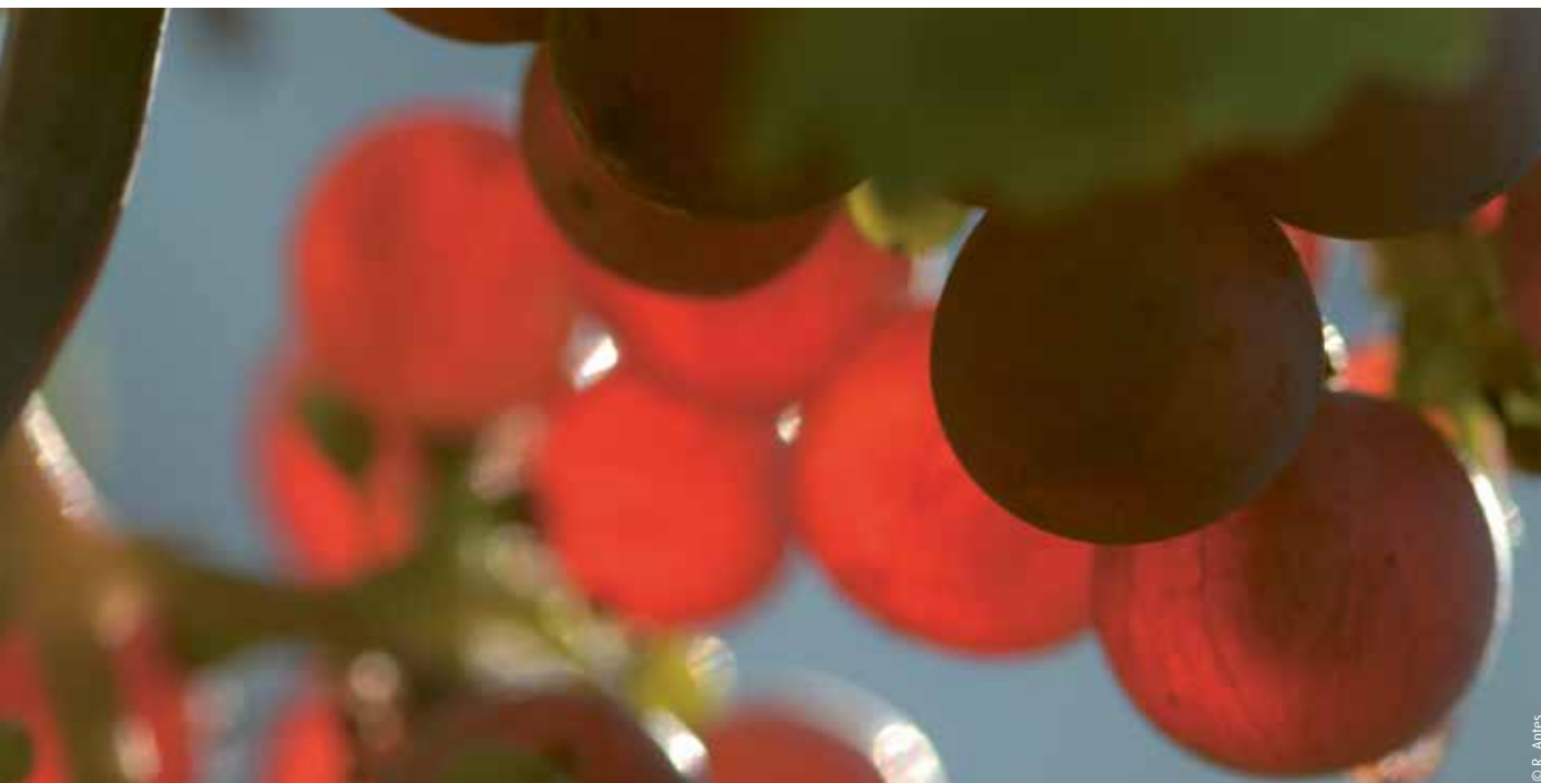
Trauben des Roten Rieslings

Ur-Riesling-Spezialität der Hessischen Bergstraße und im Rheingau