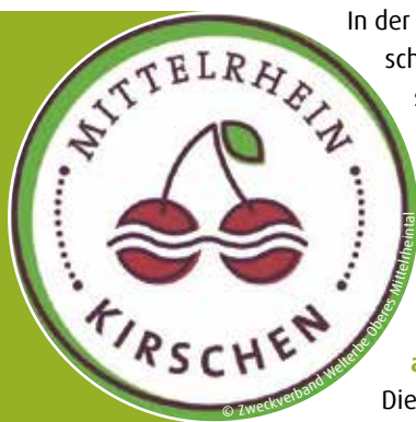
Mittelrhein-Kirschen in Filsen am Rhein

In der UNESCO Welterbe-Region Oberes Mittelrheintal werden der landschaftsprägende Kirschenanbau und die damit verbundene Kirschsorntenvielfalt als Kultur- und Naturgut gefördert. Hierfür wurde eine Wertschöpfungskette aufgebaut, die Erzeuger/innen und Verarbeitende besser vernetzt und durch Einbindung von Kommunen, Gastronomiebetrieben und der Tourismusbranche die Vermarktung forciert.