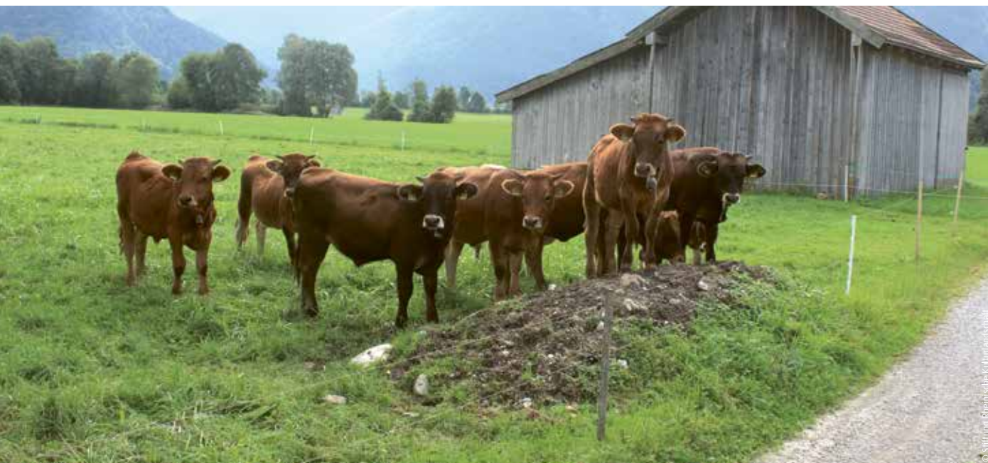
Junge Murnau-Werdenfelser Rinder auf der Weide

Eine alte bayerische Rinderasse erfolgreich in der Münchener Gastronomie und der Region Garmisch