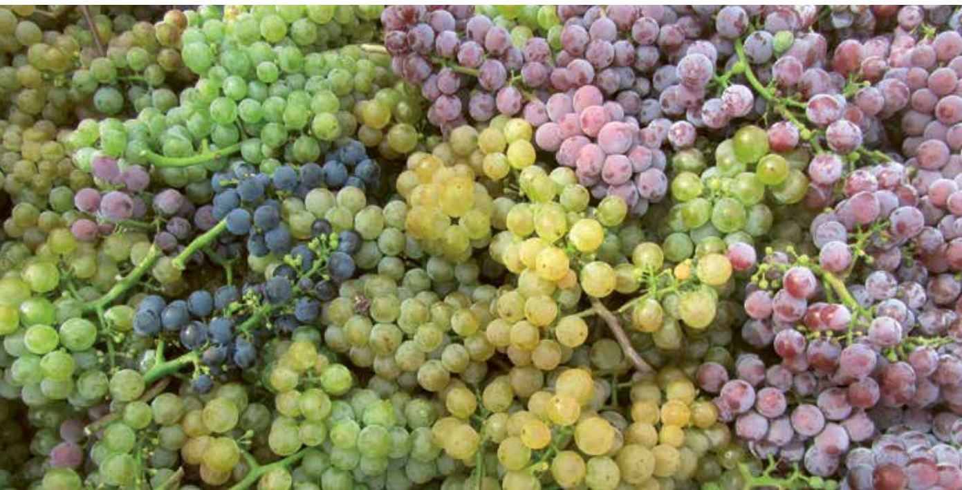
Vielfältiges Lesegut des Alten Fränkischen Satzes

Rebsorten-Vielfalt und lebendiges, regionales Kulturerbe