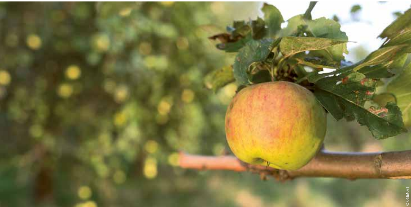
Streuobstapfel auf einer Obstwiese von OSTMOST